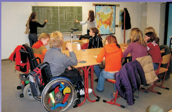
Bundesverband Selbsthilfe Körperbehinderter e.V.