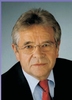
Gerd Weimer, Beauftragter der Landesregierung für die Belange von Menschen mit Behinderungen

Beauftragter der Landesregierung Baden-Württemberg für die Belange von Menschen mit Behinderungen